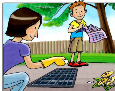
RICORDATI DI TRATTARE I TOMBINI CON PASTIGLIE DI INSETTICIDA, NEL PERIODO DA APRILE A SETTEMBRE. (*)