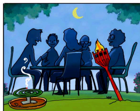
QUANDO SOGGIORNI ALL'APERTO, PROTEGGITI CON REPELLENTI AMBIENTALI. (*)

(*) Leggi attentamente le istruzioni riportate sulle confezioni.