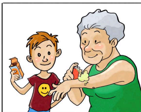
USA I REPELLENTI CUTANEI SEGUENDO LE INDICAZIONI RIPORTATE SULLE CONFEZIONI.