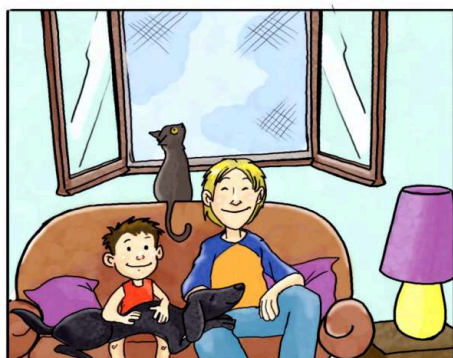
IN CASA USA LE ZANZARIERE ANZICHÉ ZAMPIRONI E FORNELLETTI.