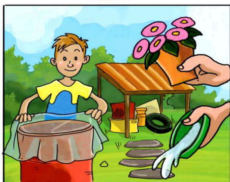
METTI AL RIPARO DALLA PIOGGIA TUTTO CIÒ CHE PUÒ RACCOLGERE ACQUA.

(*) Leggi attentamente le istruzioni riportate sulle confezioni.